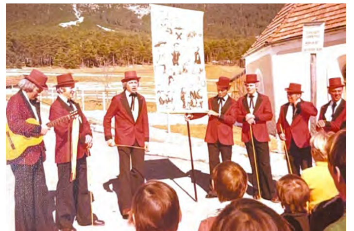
Ein Teil einer damaligen Labera-Formation