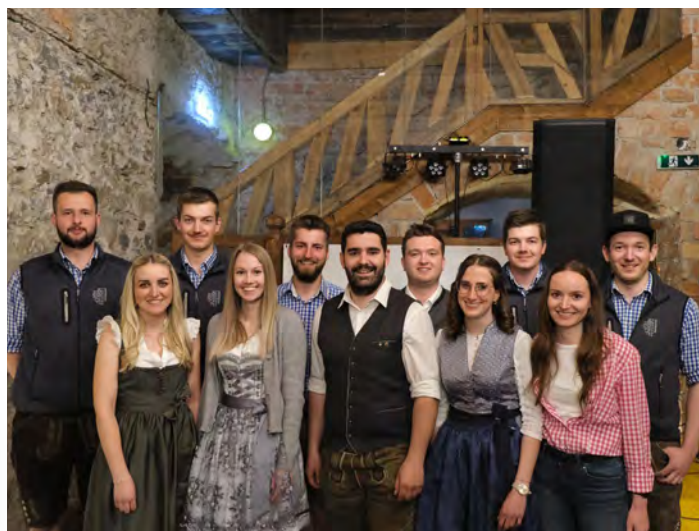
Der Ausschuss investierte zahlreiche Arbeitsstunden in die Planung und Durchführung des Brauereiballs.