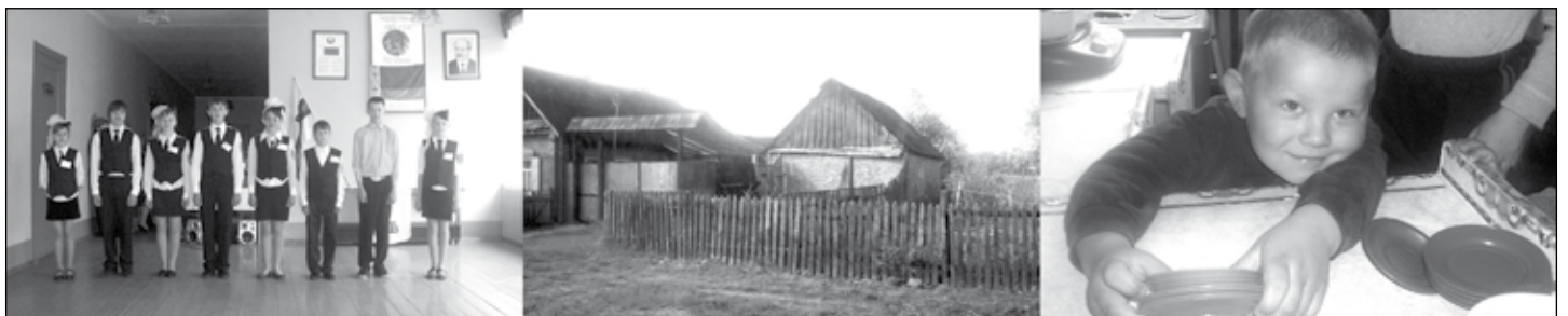
Zu Besuch in Weißrussland