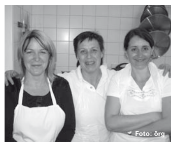
Ungeschminkt: die „Küchenfeen“