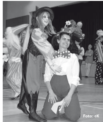
Zielsicher beim Dosenwerfen.

Ganz im Zeichen der Clowns stand der Kinderfasching in diesem Jahr.