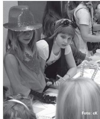
Bemalen der Clownmasken.