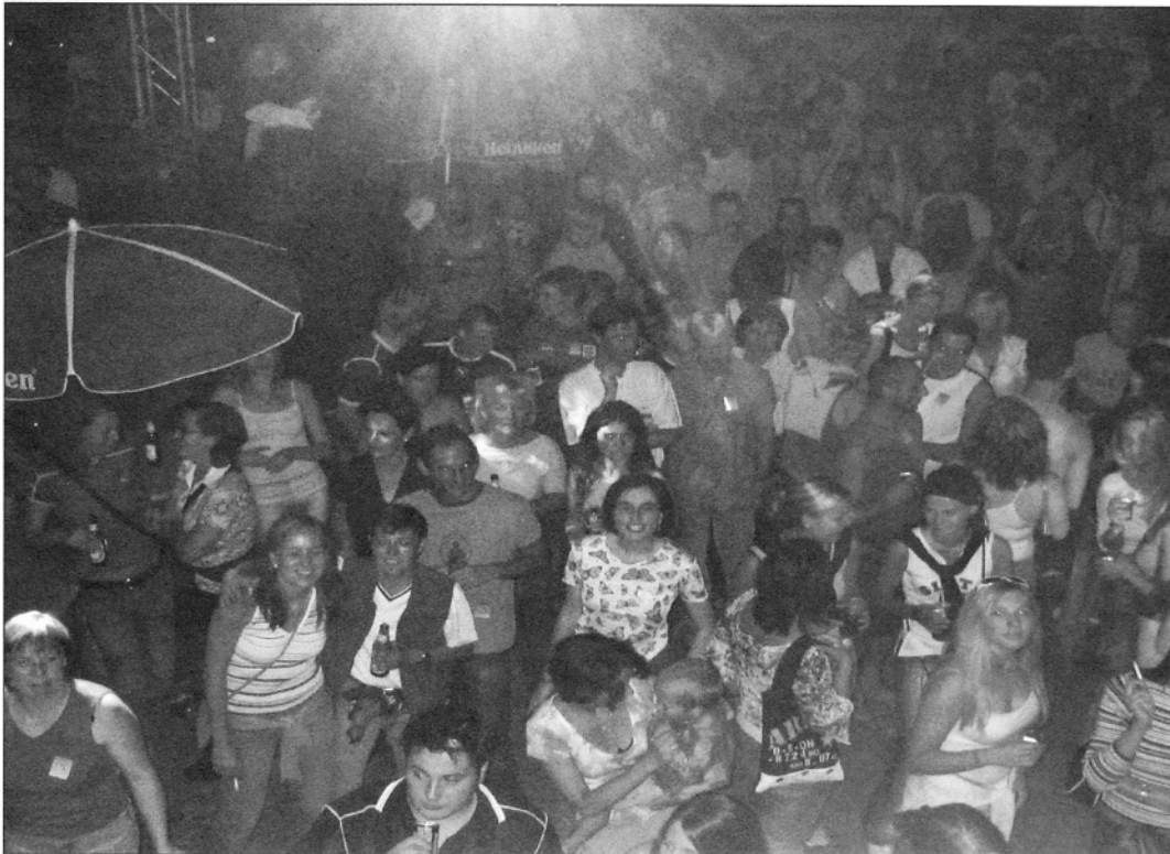
Auch heuer war wieder großartige Stimmung beim Gassenfest