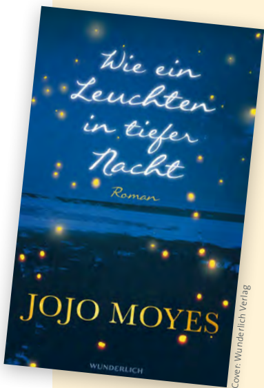
Cover: Wunderlich Verlag

Die Engländerin Alice folgt 1937 ihrem Verlobten nach Amerika. Sie träumt von den unbegrenzten Möglichkeiten in Übersee, findet sich dann aber in einem Nest in Kentucky wieder. Ihr Schwiegervater ist ein Tyrann und ihr Mann steht nicht zu ihr. Ihr Leben verändert sich, als sie sich den Frauen der Packhorse Library anschließt und kranken oder alten Menschen Bücher aus der Bücherei nach Hause bringt. Auf dem Rücken der Pferde.