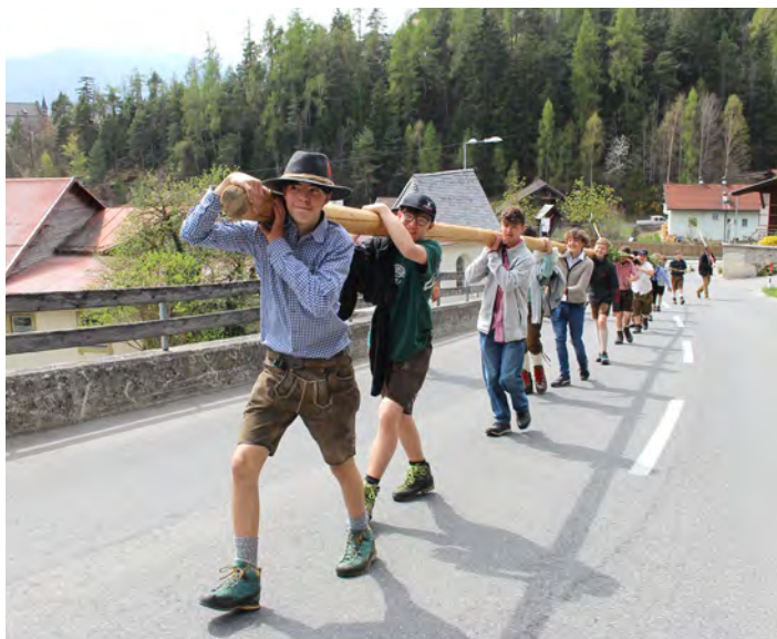
Auf dem Weg zurück nach Obtarrenz