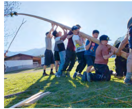
Die Probe-Aufstellung in Obtarrenz war erfolgreich

Mit Eifer, Fleiß, Zusammenarbeit, Knowhow von den „Oldies“ und vor allem Spaß haben sie es geschafft – Bravo Buaba! Vielen herzlichen Dank an alle großen und kleinen Helferlein! Mögen uns die Kinder/Jugendlichen weiterhin zeigen, wie viel Motivation, Willenskraft, Enthusiasmus und Stärke in ihnen steckt! [Manuela Posch]