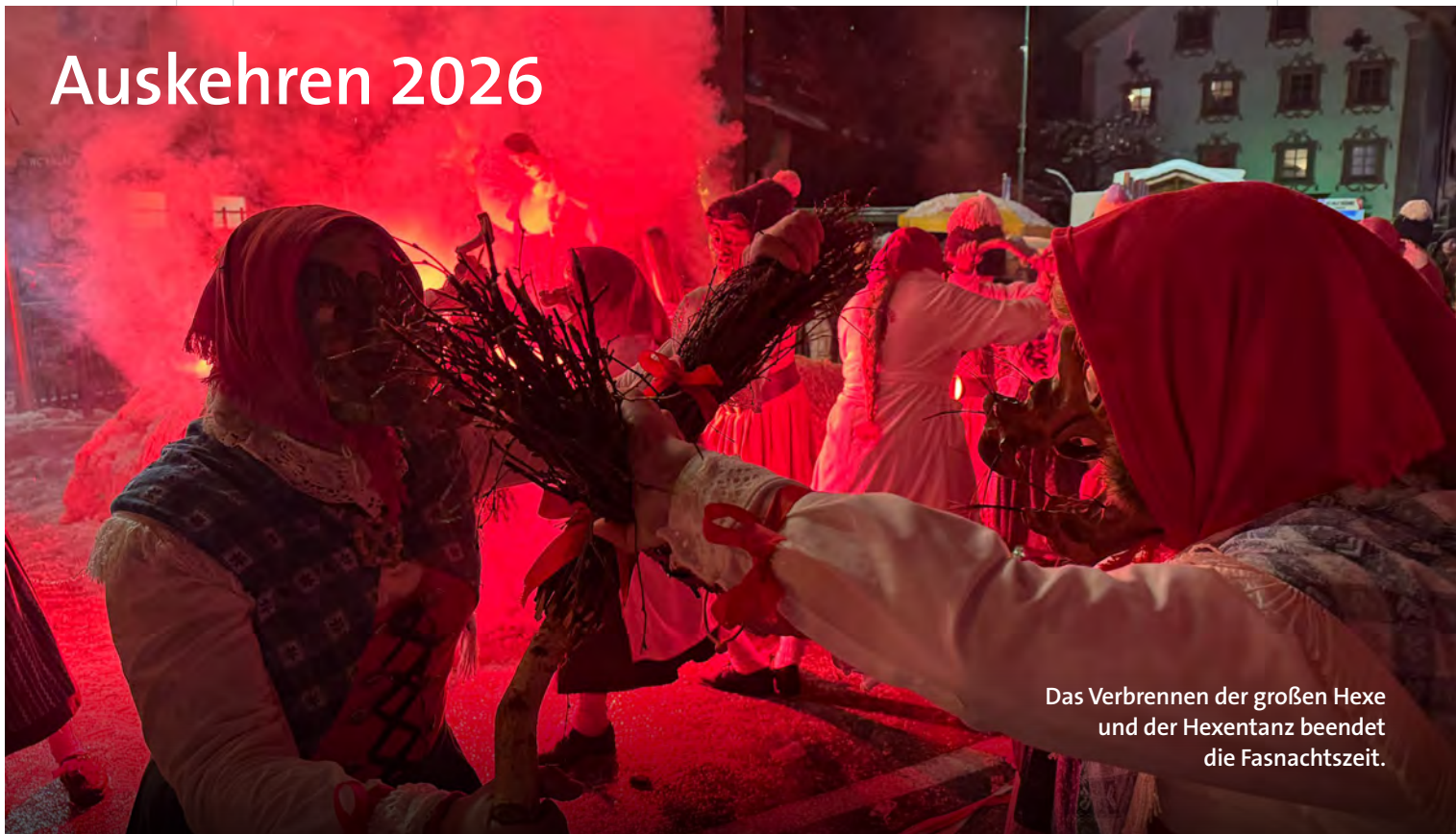
Das Verbrennen der großen Hexe und der Hexentanz beendet die Fasnachtszeit.

Traditionell am Fasnachtsdienstag fand auch heuer wieder das Auskehren mit Hexenverbrennung statt. Zahlreiche Trupps waren mit ihren „Auffiahrwagele“ unterwegs.