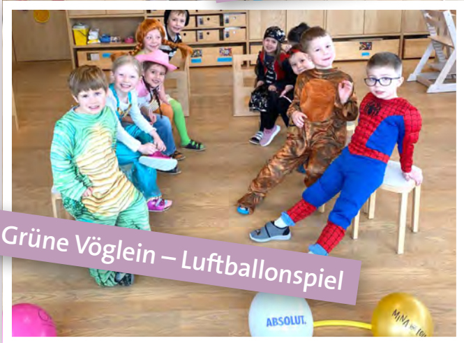
Grüne Vöglein – Luftballonspiel