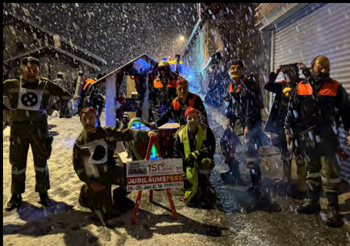
Die „Originale-Feuerwehr“ bereitete sich auf die 150-Jahr-Feier der Feuerwehr Tarrenz vor.