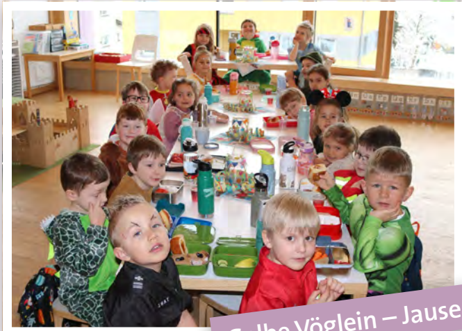
Gelbe Vöglein – Jause

Bunt, laut und herrlich war unsere Faschingszeit. Wir sangen coole Lieder, hatten viel Spaß bei Spielen und Discotänzen, machten wilde Luftballonschlachten und sogar der Kasperl kam zu Besuch. Den krönenden Abschluss bildete die gemeinsame Faschingsparty. Bei den vielen einfallreichen Stationen konnten sich die Kinder austoben und erlebten einen wahrlich monsterstarken Vormittag! [Ramona Hackl]