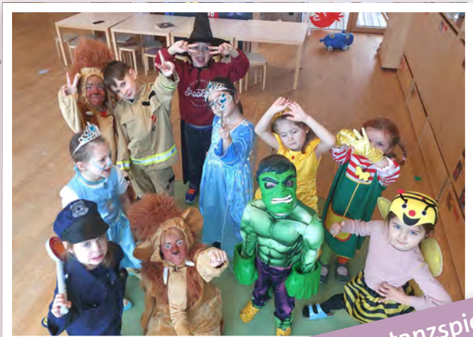
Rote Vöglein – Stopptanzspiel